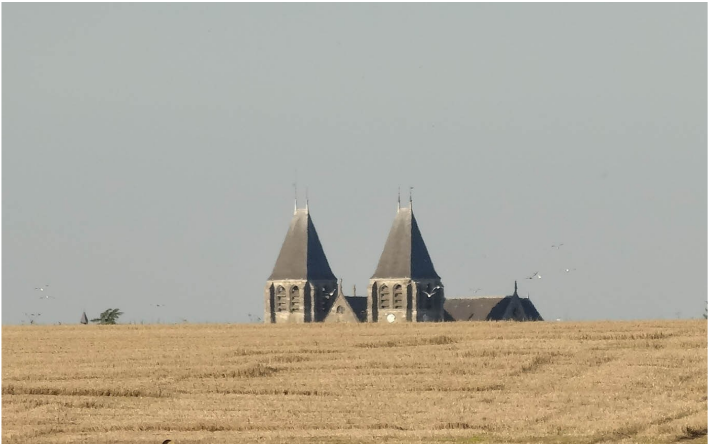
Photographie du monument historique